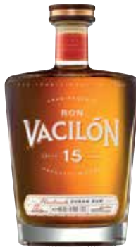
Gran Reserva 15 Años Seite 22