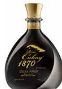
Extra Añejo 1870 Seite 28