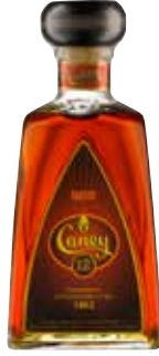
12 Años Seite 32