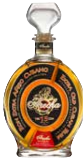
Extra Añejo 15 Años Seite 36