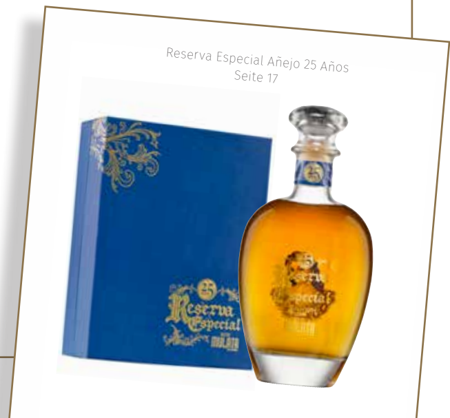
Reserva Especial Añejo 25 Años Seite 17