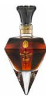
Santiago de Cuba 500 Seite 46