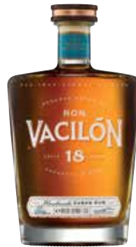
Reserva Especial 18 Años Seite 22