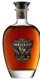
Siglo y 1/2 Seite 44