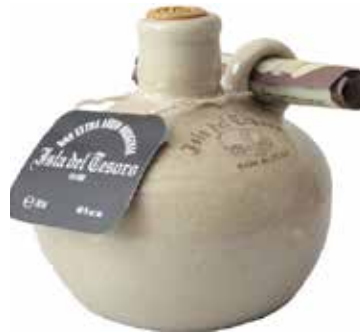
Isla del Tesoro Seite 49