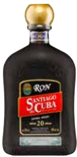
Extra Añejo 20 Años Seite 43