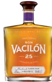
Gran Paraiso 25 Años Seite 23