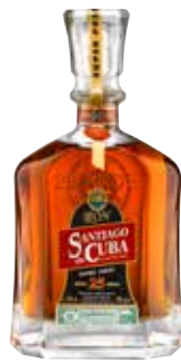
Extra Añejo 25 Años Seite 43