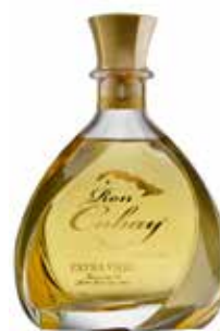
Carta Blanca Extra Añejo Seite 28